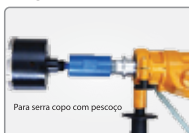
ADCE Adaptador CE - Fêmea 1.1/4" Macho M16x2,0 - com pescoço