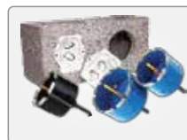
Serra Copo Diamantada Caixa Elétrica Redonda