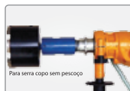
ADCE114 Adaptador CE - Fêmea 1.1/4" Macho M16x1,5 - sem pescoço